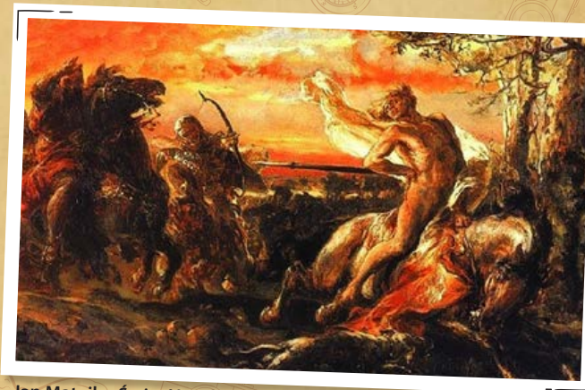
Jan Matejko Śmierć Leszka Białego