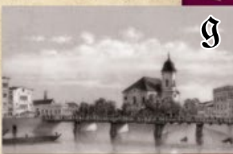
Zbór św. Krzyża (1786–1945 r.)

Stoisz przed pierwszą murowaną świątynią ewangelicką w Poznaniu wzniesioną w latach 1777–1786. Prostokątna bryła kościoła skrywa koliste, klasycystyczne wnętrza otoczone emporami – typowymi dla zborów balkonami.