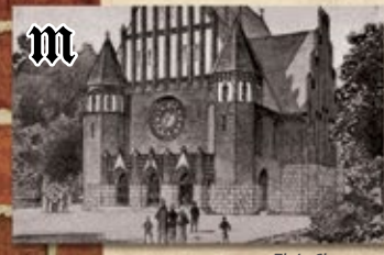
Zbór Chrystusa (1907–1945 r.)

Neogotycka świątynia wzniesiona w latach 1892–1894 jako kościół garnizonowy. Z jego wyposażenia zachowały się ławki, organy, stółka empor oraz chrzcielnica – obecnie kropielnica. Znajdź dawną pastorówkę.