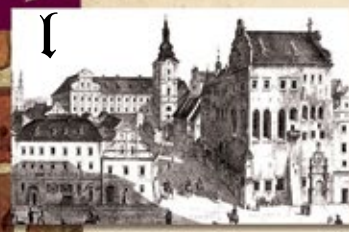
Pałac Górków (1562–1592 r.)

W pałacowej kaplicy magnackiej rodu Górków poznańscy ewangelicy gromadzili się na spotkaniach w XVI w. Do dziś zachowały się tu wczesnorenansansowe elementy architektoniczne: dziedziniec z krużgankami i portale.