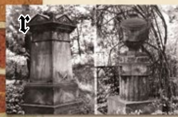
Kościół staroluterski (od 1886 r.) i cmentarz świętokrzyski (1828–1950 r.)

W pałacowej kaplicy magnackiej rodu Górków poznańscy ewangelicy gromadzili się na spotkaniach w XVI w. Do dziś zachowały się tu wczesnorenansansowe elementy architektoniczne: dziedziniec z krużgankami i portale.