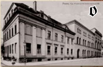
Gimnazjum Fryderyka Wilhelma (1834–1920 r.)

Gimnazjum protestanckie powstało w wyniku podziału jedyne działającego w Poznaniu gimnazjum na dwa – katolickie i ewangelickie. W 1857 r. zostało ono rozbudowane o gmach utrzymane w stylu arkadowym.