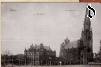
Zbór św. Pawła (1869–1945 r.)

Świątynia wzniesiona została w latach 60. XIX w. jako pierwsza neogotycka budowla sakralna w mieście, a jej wieża górowała nad otoczeniem. Pastorzy zboru obsługiwali również kaplicę ewangelicką w zamku cesarskim.