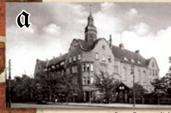
Dom Ewangelicki (1908–1945 r.)

Kościół ten jako jedyny do dziś służy protestantom. W portalu wejściowym znajdziesz... kolumny pochodzące z nagrobków. Jest to jedyny ślad cmentarza, który dawniej znajdował się na terenie sąsiedniego parku.