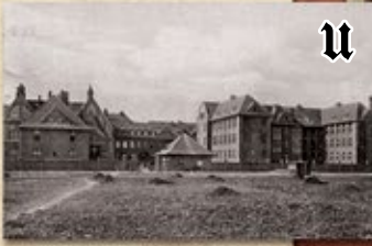
Kompleks szpitalno-zakony diakonisek (1911–1945 r.)

Znajdź głaz pamiątkowy znajdujący się w parku nieopodal dawnej kaplicy cmentarnej zborów św. Pawła i św. Łukasza vis-à-vis dawnego Zakładu Diakonisek. Podejdź również do współczesnego ewangelickiego kościoła Łaski Bożej.