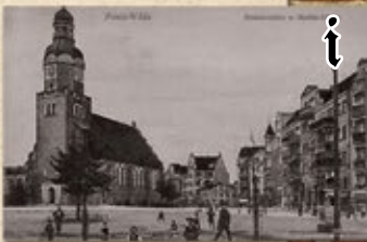
Zbór św. Mateusza (1907–1945 r.)

Zwróć uwagę na główny portal utrzymany w stylu neomanierystycznym. W świątyni z protestanckiego wyposażenia pozostały empory i chrzcielnica. Jest tu również tablica pamiątkowa poświęcona wildeckim ewangelikom.