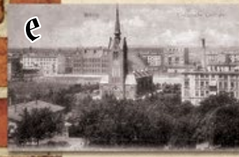
Zbór św. Łukasza (1894–1945 r.)

Początkowo znajdował się tutaj Ewangelicki Dom Związkowy z przytulkiem, będący miejscem spotkań kulturalno-towarzyskich. Bryła budynku, typowa dla budownictwa pruskiego, dekorowana jest motywami secesyjnymi.